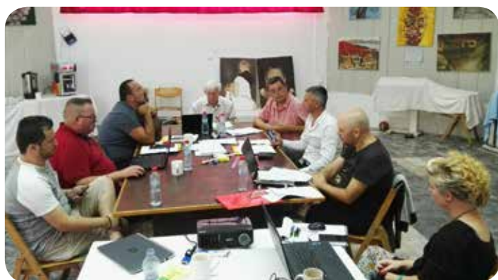
Συνάντηση του Δ.Σ. του DPNSEE