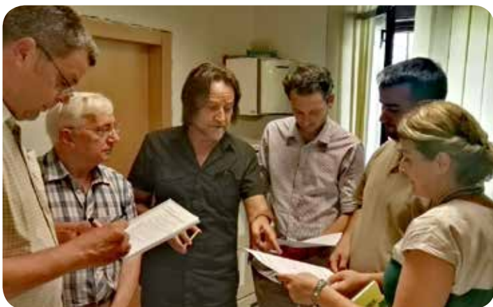
Επίσκεψη στο Κόσοβο