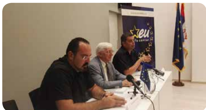
Συνέντευξη Τύπου στο Κέντρο Πληροφόρησης της ΕΕ.