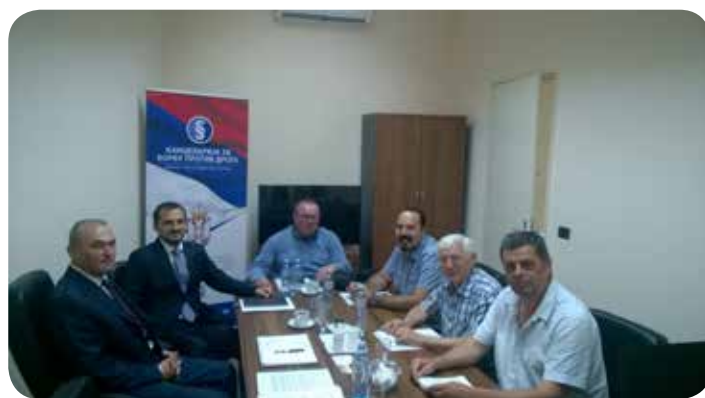
Επίσκεψη στη Σερβία